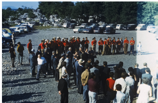
Pâques 1967: inauguration de la Grotte de la Cocalière

Fort de tous ses efforts, la Grotte de la Cocalière devient en 2013, Relais d'information du Parc national des Cévennes et Esprit parc national en 2017.